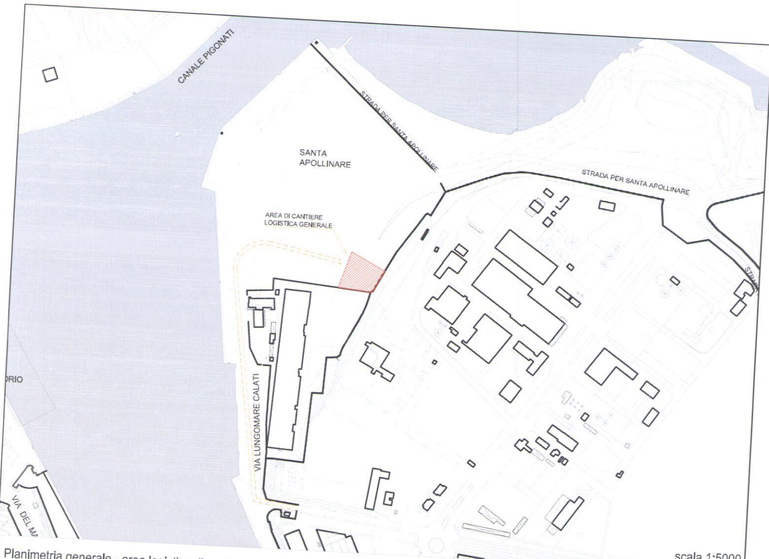
Planimetria generale - area logistica di cantiere