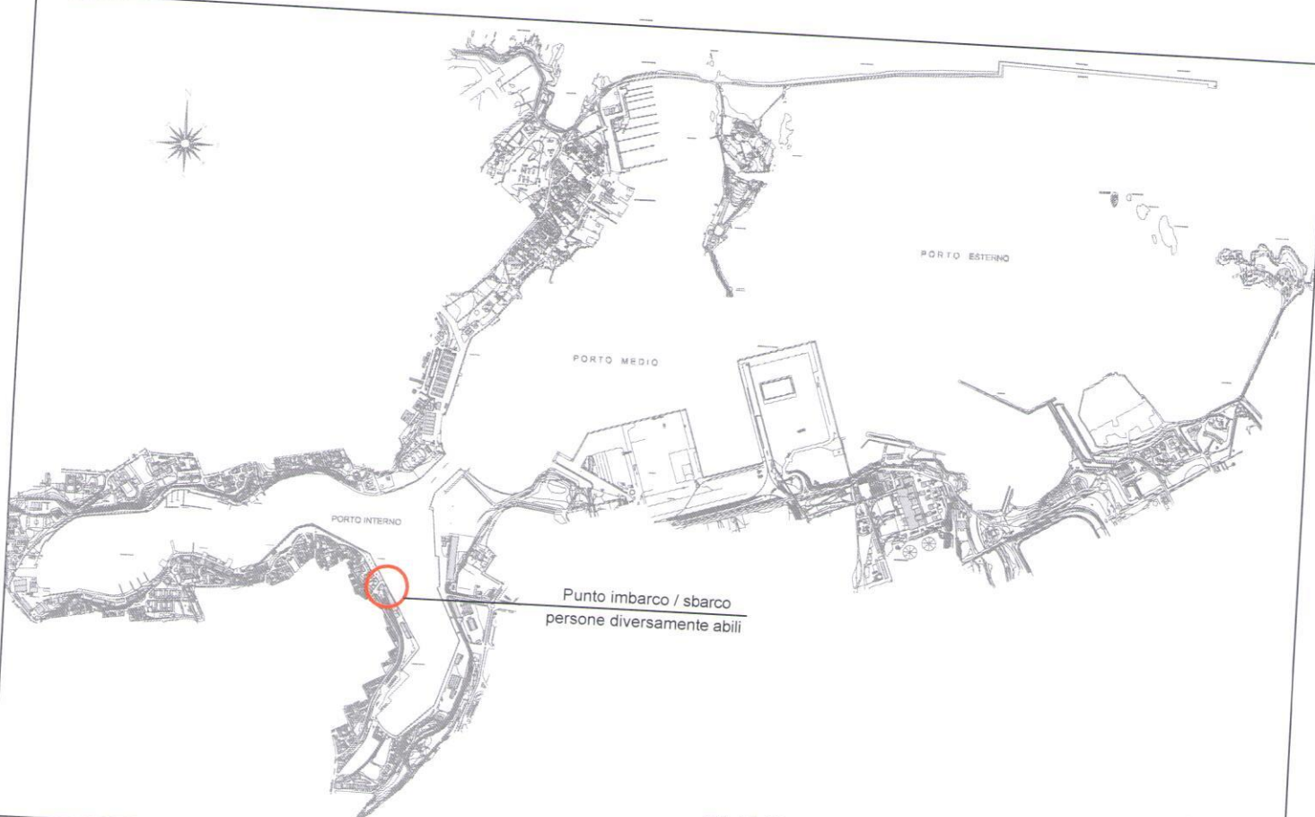
PLANIMETRIA GENERALE PORTO DI BRINDISI