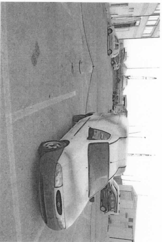
FORD COURIER (WF03XXBAJ3WP20383)