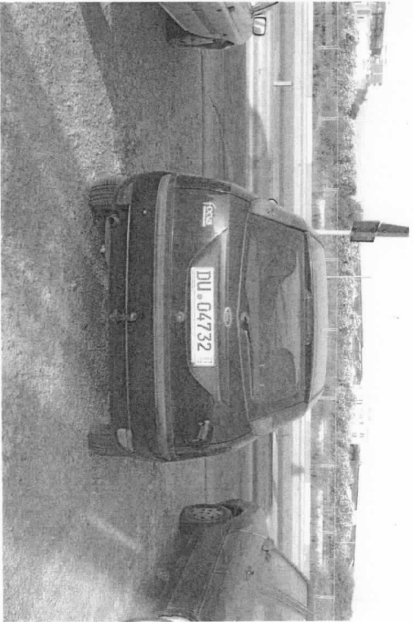
FORD FOCUS (DU04732)