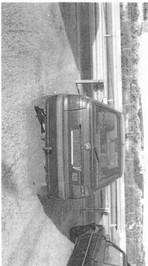
SKODA FELICIA (TMBEGF614W0823214)