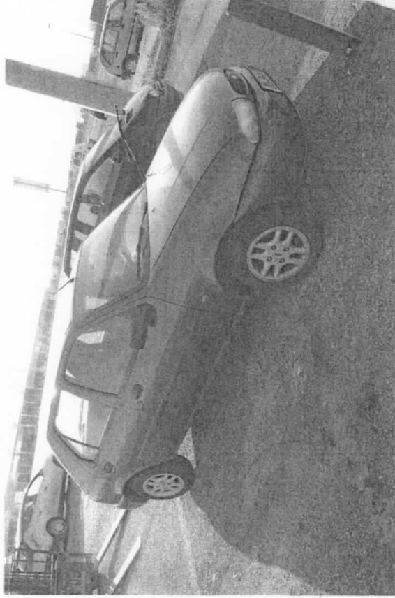
FORD FIESTA (DU341ID)