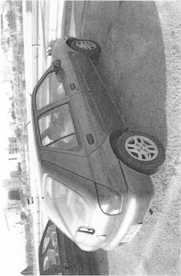
FORD FIESTA (DU341ID)