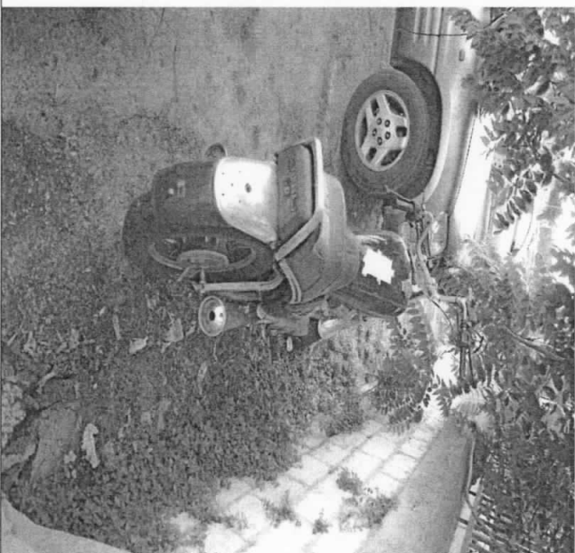
MOTO YAMAHA SPECIAL (26R-013409)